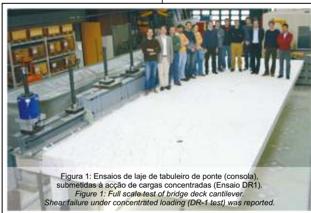
Figura 1: Ensaios de laje de tabuleiro de ponte (consola), submetidas à acção de cargas concentradas (Ensaio DR1). Figure 1: Full scale test of bridge deck cantilever. Shear failure under concentrated loading (DR-1 test) was reported.

Reinforced concrete bridge deck slabs without shear reinforcement can be subjected to concentrated or distributed loads of important magnitude. Under these loads their structural response is not always ductile. In particular under concentrated loads their deformation capacity can be limited by shear or punching shear failures, which prevent them from reaching the ultimate load predicted by pure flexural analysis. This problem has been studied in this research by means of an important experimental program and theoretical modeling. The limited ductility of bridge decks was investigated by means of full scale tests on bridge deck cantilevers under groups of concentrated loads. Six large scale laboratory tests were performed on bridge deck cantilevers (Fig. 1). All slabs failed in a brittle manner, in shear or punching shear. The theoretical flexural failure load estimated using the yield-line method was never attained. A non linear finite element model was implemented during this work and used to correctly predict the measured rotations and load-displacements curves of the tested cantilevers and other full scale tests performed by other researchers. The measured failure loads are accurately estimated by using the results of the non-linear model and punching shear criteria proposed by CSCT (Critical Shear Crack Theory), adopted by Model Code 2010 for punching shear strength.